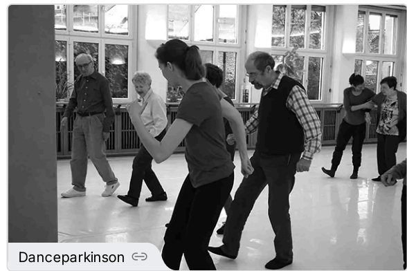
Dance for Parkinson - Ein Tanzkurs für Menschen mit Parkinson

⇒ Rehaklinik Zihlschlacht AG, Hauptstrasse 2, 8588 Zihlschlacht-Sitterdorf