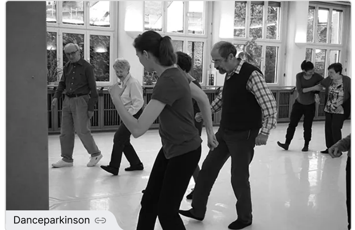
Dance for Parkinson - Ein Tanzkurs für Menschen mit Parkinson